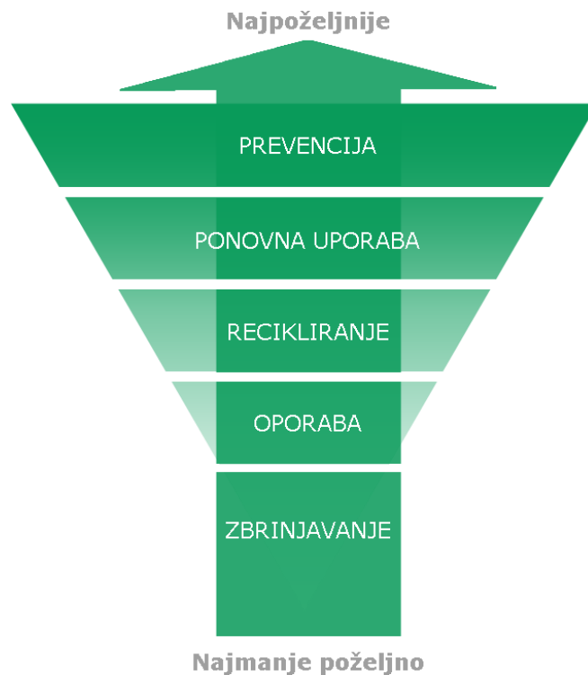
Slika 1.: Hijerarhija gospodarenja otpadom.

Novi Zakon o gospodarenju otpadom propisuje obvezu odvojenog prikupljanja otpada